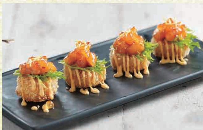
サーモンライスコロッケ 🍴 $7.80 Salmon Rice Korokke deep-fried sushi rice topped with sweet & spicy marinated salmon