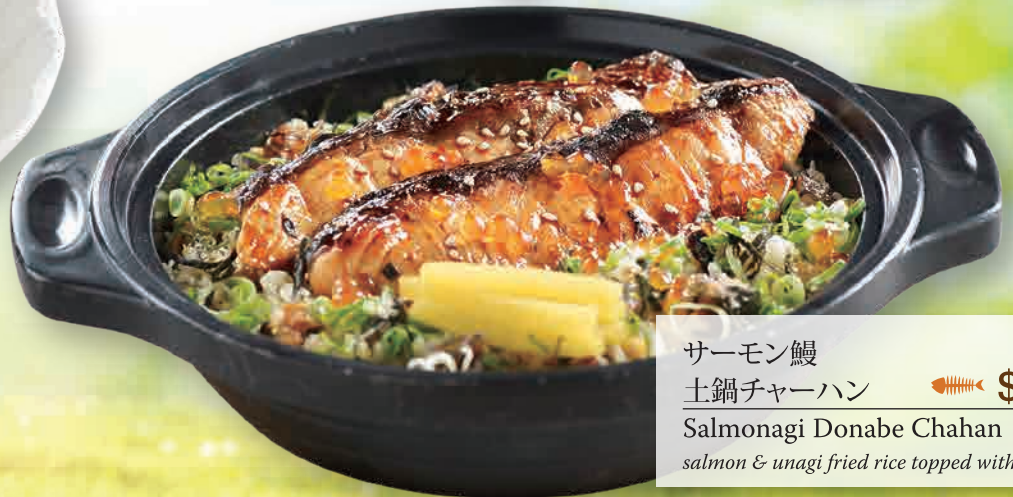
サーモン鰻 土鍋チャーハン 🐟 $17.80 Salmonagi Donabe Chahan salmon & unagi fried rice topped with salmon roe