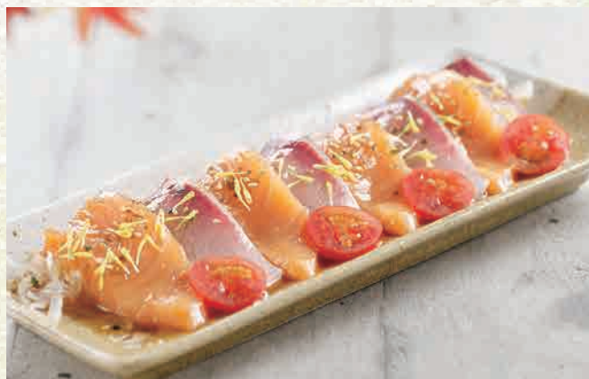
サーモンとはまちのカルパッチョ 🍴 $15.80 Salmon & Hamachi Carpaccio japanese style salmon & yellow-tail carpaccio