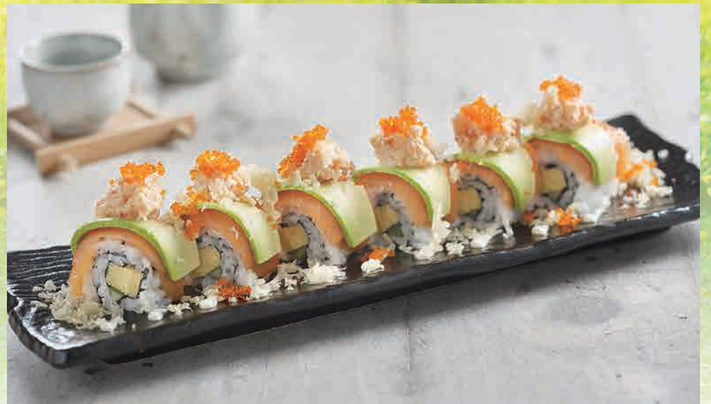
サーモンとアボカドブリスロール 🍴 $15.80 Salmon Avocado Bliss Roll omelette & cucumber sushi roll topped with salmon, avocado & lobster salad