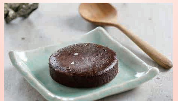
チョコレートフォンデュケーキ 🍰 $8.80 Chocolate Fondant Cake chocolate lava cake