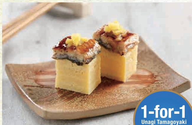
鰻玉子焼き 🐟 $6.80 Unagi Tamagoyaki omelette topped with premium eel