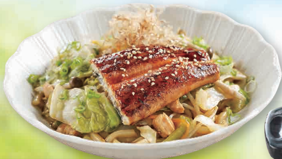
サーモン鰻 ウースターソースうどん 🐟 $18.80 Salmonagi Usuta Sosu Udon salmon & unagi pan-fried noodles with special sauce