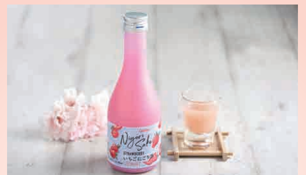
大関いちごにごり酒 🍷 $16.80 Ozeki Strawberry Nigori japanese rice wine blended with strawberry juice