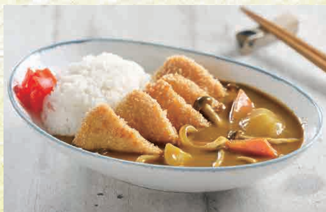
サーモンカツカレーライス 🍴 $15.80 Salmon Katsu Curry Rice salmon cutlet curry rice